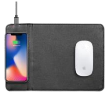
POWER PAD #CM5335

Slim design 8000 mAH powerbank & wireless charger in 1. Input: AC-DC 5V/1.5A. Output 5V/1A. Power 5W. Launch distance : 3mm.