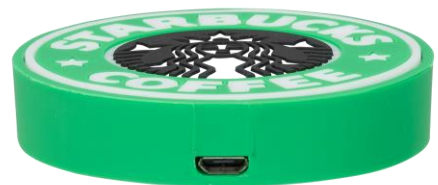
WIRELESS CHARGER CUSTOM #CM5332

Create your own shape wireless charger from only 100 pcs! Input: AC-DC 5V/1.5A. Output 5V/1A. Power 5W. Launch distance : 4-8mm.